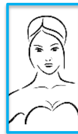
Hochkant bis Brust