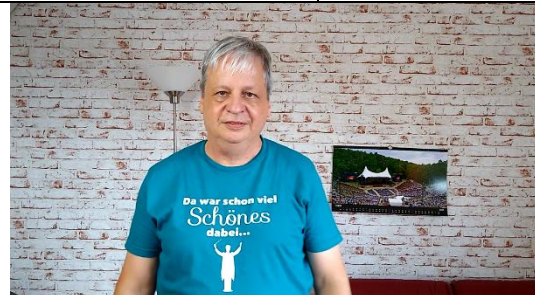
Querformat statt Hochkant