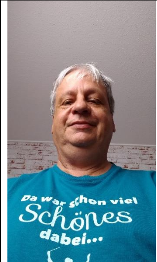
Kamera nicht auf Kopfhöhe