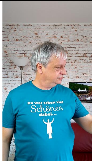
Blick nicht in Kamera