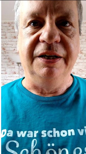
Ausschnitt zu klein