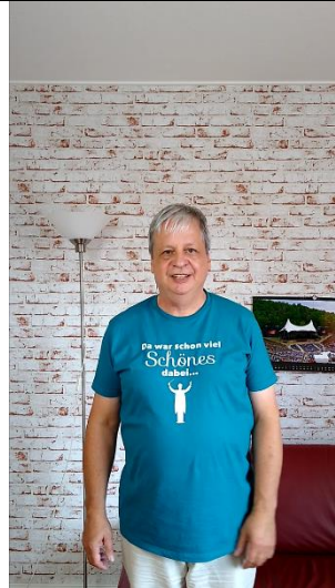
Ausschnitt zu groß