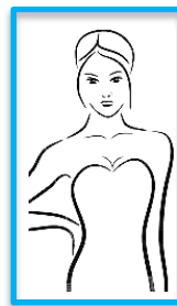
Hochkant bis Hüfte