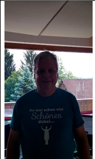
Licht von hinten