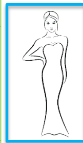
Hochkant mit Füßen