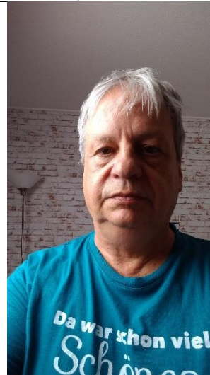
Licht von Seite